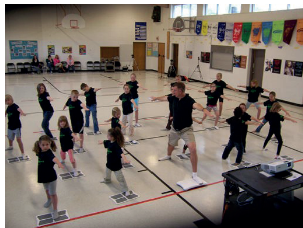
Slika 4. Primena Nintendo Wii Fit konzole u fizičkom vaspitanju

Jedan od uspešnijih načina primene AVI u fizičkom vaspitanju je putem Nintendo Wii konzole i igre Wii Fit. Wii Fit je predstavljen javnosti 2007. godine u Japanu i od tog vremena je postigao veliku popularnost širom sveta. U suštini, Wii Fit predstavlja video igru sa elementima fizičkog vežbanja na ploči za balansiranje. Ova ploča omogućava „interpretaciju“ pokreta celog tela igrača koji se koriste kao osnova za kontrolu pokreta u okviru igre. To znači da igrači fizički pokreću celo telo u cilju kontrolisanja likova na ekranu u različitim aktivnostima kao što su joga, skijanje, trčanje ili vežbe za jačanje mišića.