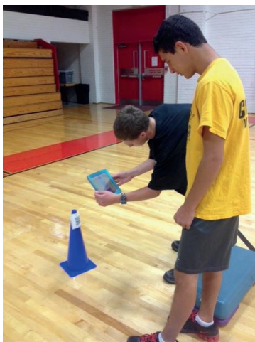
Slika 3. Učenici skeniraju QR kod na radnoj stanici u kružnom vežbanju na času fizičkog vaspitanja

Sledeći način primene čitača QR kodova su takozvane Digitalne kartice sa zadacima (Digital Task Cards), gde se učenicima prikazuju određeni sportsko-tehnički elementi koje treba da usvoje/savladaju. Snimljeni materijal treba da bude visokog kvaliteta u smislu motoričkog izvođenja – demonstracije, kako bi učenici „imitirali“ dobar model izvođenja.