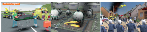
Slika 2. Izvod iz jedne od obuka i upotrebe softverskog rešenja[6]

Sledeći primer softvera koji se koristi u simulaciji vanrednih situacija i u obuci jeste proizvod kompanije C4i. C4i je američka kompanija u privatnom vlasništvu čija je vizija da učini svet sigurnim kroz obuku i tehnologiju. Stručne oblasti koje pokriva ova kompanija uključuju najsavremenije simulacije i softverska rešenja za obuku i razvoj, a sve na osnovu prilagođenog softvera. Jedan od softvera koji je ova kompanija razvila za potrebe obuke za reagovanje u vanrednim situacijama jeste EDMSIM. EDMSIM je interaktivno, softversko rešenje za obuku za vanredne situacije. Softversko rešenje je posebno dizajnirano za operativne snage koje se aktiviraju u slučaju vanrednih situacija, kao i za operativne centre i civilno rukovodstvo. Softver je vrlo fleksibilan i prilagodljiv alat. EDMSIM omogućava timovima koji