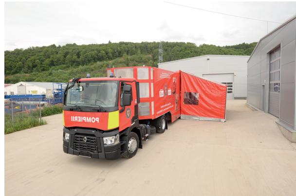
Slika 1. Izgled kamiona koji je opremljen softverom za simulaciju vanrednih situacija [5]

Jedan od primera je zajednička saradnja rumunske kompanije Deltamed i i holandskog konzorcijuma. Naime, rumunska kompanija izrađuje specijalizovana vozila sa posebnom opremom u koja se ugrađuju softverska rešenja za simulacije vanrednih situacija izrađena od strane holandskog konzorcijuma. Kompanija Deltamed je specijalizovani proizvođač vozila koja se koriste u radu hitnih službi. Upravo, jedan od tipova vozila predstavlja kamion koji je opremljen posebnim softverom koji proizvodi holandski konzorcijum i koji se koristi u obuci različitih kategorija koji mogu biti pogođeni vanrednim situacijama ili reagovati u svojstvu operativnih snaga.