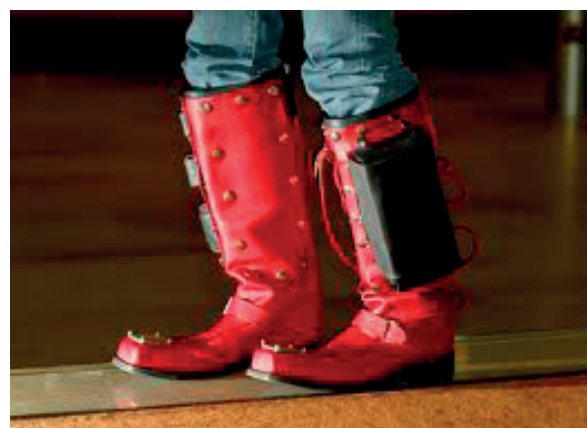
Slika 4. Laura Belof, Erich Berger i Martin Pihmaer, Čizmama od sedam milja (Seven Mile Boots, 2003)

Još jedan projekat koji koristi nosivu tehnologiju kako bi podsticao individuu da nadgleda online aktivnosti drugih, je Jing Gao-in Indeks ravnodušnosti (Index of Indifference, 2006). Fokus njenog projekta virtualizacije, međutim, više je političko nego socijalno ponašanje (slika 5). Indeks ravnodušnosti predstavlja instalaciju odevnih predmeta dizajniranih da preokrenu neutralne političke stavove online anketiranih ispitanika (Seymour, 2008,34). Tokom četiri nedelje, Gao je koristila kompjuterski program kako bi sastavila frekvenciju „ravnodušnih“ odgovora na online pregled stavova, i u skladu sa tim podacima, ona je remodelovala deset muških košulja. Unos podataka nije bio proizvoljan ili slučajan, već naprotiv, bio je vrlo nameran sa ciljem da se obrati problemu političke apatije generisanom i izraženom u online društvima (Seymour, 2008,34).