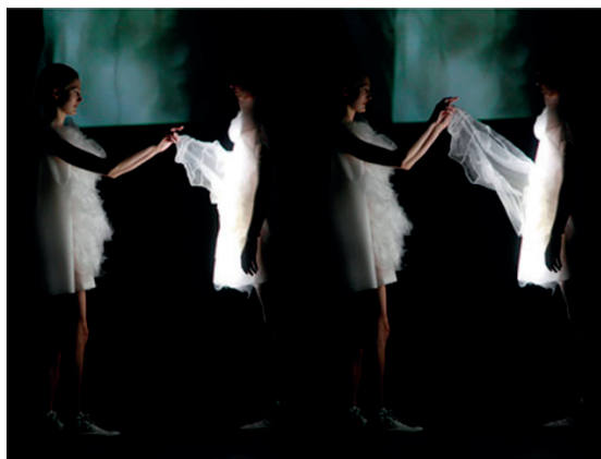
Slika 3. XS Laboratorija, Sazvežđe (Constellation Dress), 2004.