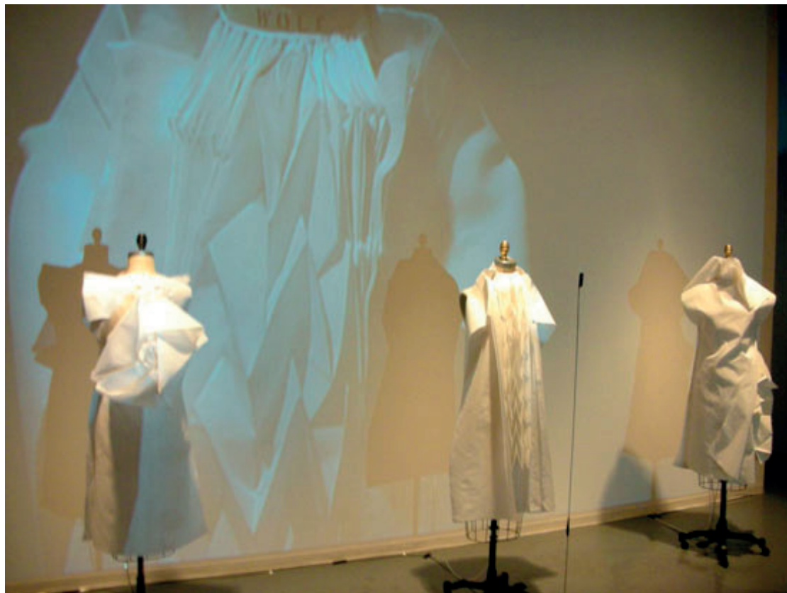
Slika 5. Jing Gao, Indeks ravnodušnosti (Index of Indifference, 2006)

manipulativnim kvalitetima vizuelizacije podataka kroz „nosivu tehnologiju“, Gao pokušava da se suoči sa primenom apatijom koja se podstaknuta anonimnošću online društva drastično proširila. Njena tehno – utopijska politička strategija, slično idejama italijanskog futurizma i projektu Antineutralnog odela (Antineutral Suit 1914), otkriva antineutralni prizor dinamičke krojačke modifikacije.