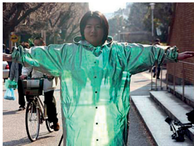
Slika 1. Suzumu Taki, Nevidljivi ogrtač ( Invisibility Cloak , 2003)

Svi savremeni projekti „nosive tehnologije“ koji su bili predmet moje analize, imaju potencijal da generišu fodbek između tela i ostalih subjekata, između prirodnog okruženja i tehnoloških sistema. Utopijsko obrazloženje za razvoj ovog „fodbek odgovora“ predstavlja konceptualizovanje tela kao segmenta kojim upravlja jedinstven tehnološki red koji kontroliše celokupnost živih bića i prirodnog univerzuma uopšte, kao i veštačke materije – artefakte ljudske ruke, ali i najvažnijeg označavanja informatičkog doba: podatak. Utopijska ideja tehnološkog ekosistema jeste da napredna kibernetika povrati „prirodni“ red ili balans. Ova ideja jedinstvenog tehnološkog reda sugerise da tehnologija prosto nije dovoljno odmakla i da je disfunkcionalnost sadašnjosti uzrokovana neharmoničnim odnosom između prirode i tehnologije (kao veštačke tvorevine). Zamišljeno tehnološko rešenje predstavlja stvaranje harmonije zamagljivanjem granica između tela i tehnologije, ekosistema i kibernetičkog sistema, društva i online mreže.