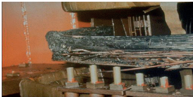
Prikaz 2: Bliži pogled na delove transformatora koji su oštećeni tokom solarnog udara u Salem nuklearnoj elektrani.

povećanjen inteziteta solarnih oluja, povećava se i kapacitet stvaranja katastrofa većih razmera koje mogu biti i regionalnog karaktera. Oštećene elemente distributivne mreže električne energije, je teško nabaviti u kratkom vremenskom roku, uzimajući iskustva nekih bogatijih zemalja (BDP per capita, pokazatelj)[1]. Shvatili smo da je potrebno nekoliko meseci da se nabave delovi, zbog svoje unikatnosti i nepostojanja zaliha istih (pogledati Prikaz br.2).