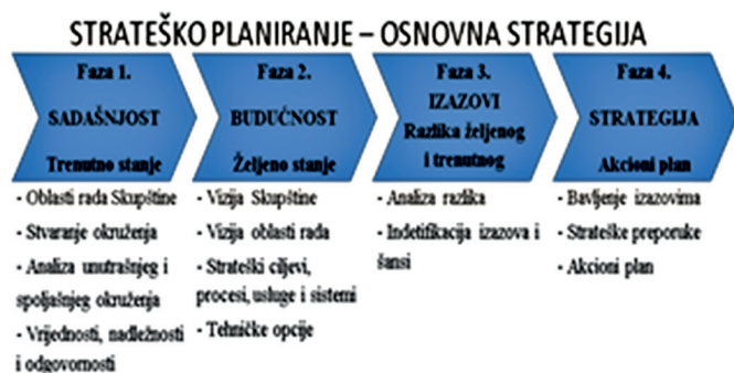
Fig. 1. Faze strateškog planiranja u skupštini Crne Gore

Parlamenti se obično nalaze u glavnim gradovima država, gdje je internet obično dobar, tako da većina njih, pa čak i oni u nerazvijenim državama počinju da koriste ICT da poboljšaju njihove komunikacione i informacione kapacitete [8]. Internet je povećao mogućnosti interakcije između javnosti, parlamenta i vlade, putem e-pošte, diskusionih grupa i elektronskih forumima, i može se smatrati instrumentom aktiviranja građanski zasnovane demokratije i osporavanja monopola postojećih političkih hijerarhija [9].